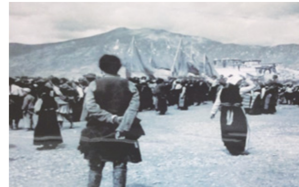
Chinese army marching in front of Potala Palace, Lhasa 1952