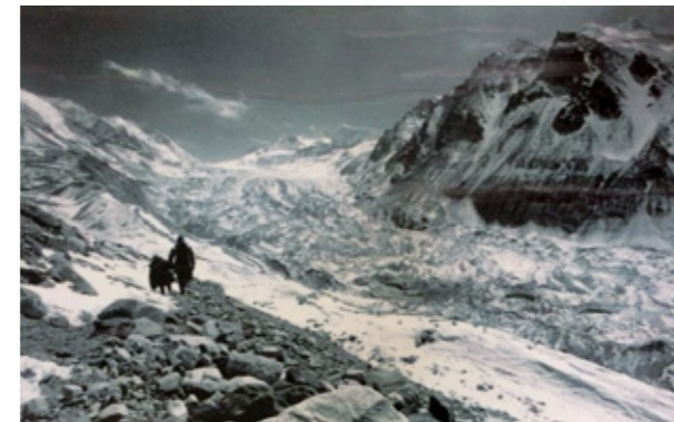
Father and Daughter crossing a 5700-meter pass during their escape from Tibet, 1996

FREITAG, 6.9.19, 20.30 Uhr EINEWELTHAUS, Terrasse (bei Regen im Haus) FRISCHLUFTKINO: GENERATIONENWECHSEL