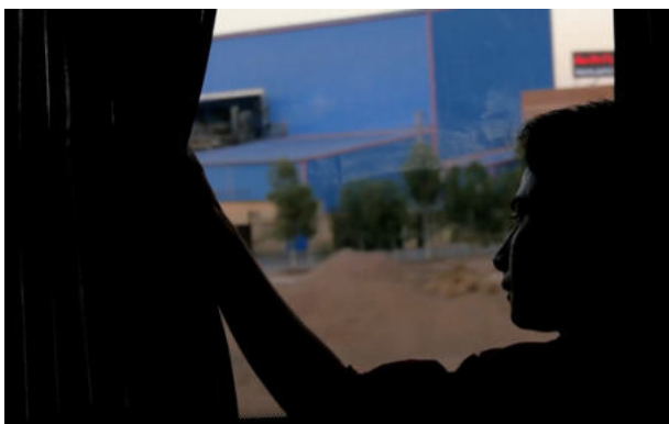
Szene aus dem Film „My Way“.